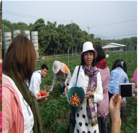
นักท่องเที่ยวเก็บ สตอเบอร์รี่สดจากไร่ด้วยตัวเอง เชียงใหม่