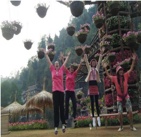
สวนดอกไม้โครงการหลวงดอยอ่างขาง จ. เชียงใหม่