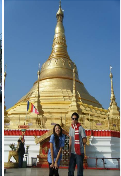
พระธาตุขวงดวงจําลอง ท่าขี้เหล็ก พม่า