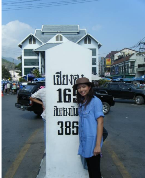
ตลาดแม่สาย เชียงราย